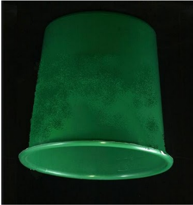
Ari-ari yang diberi penerangan lampu, di sebagian daerah menggunakan media ember